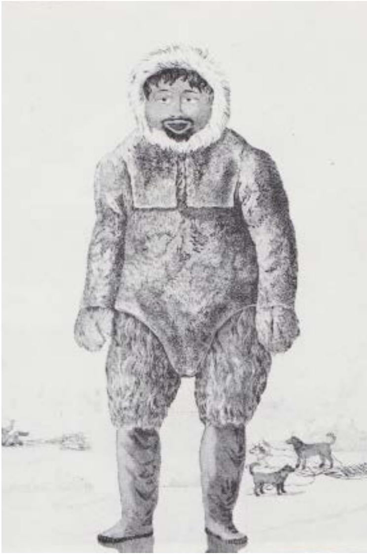
Jean Malaurie, Les Derniers Rois de Thulé , Plon 1955, 5e éd., 1989, p.95.